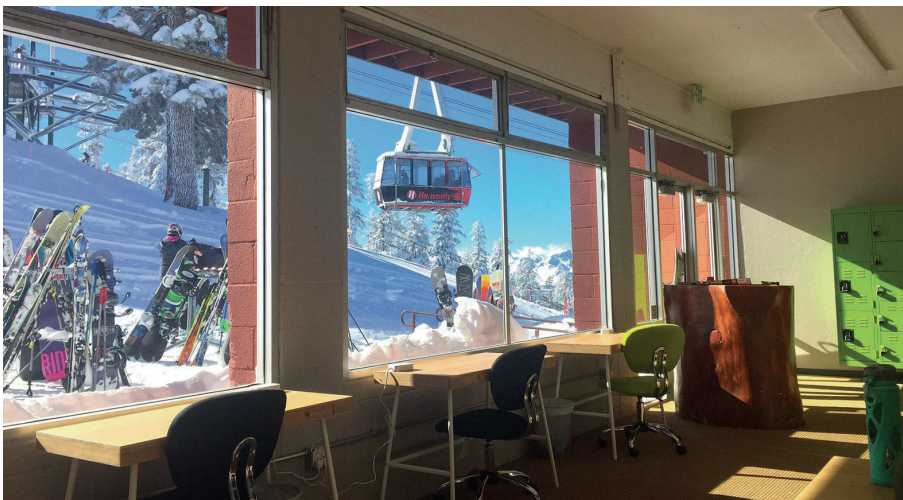
〈그림〉 타호 마운틴 랩