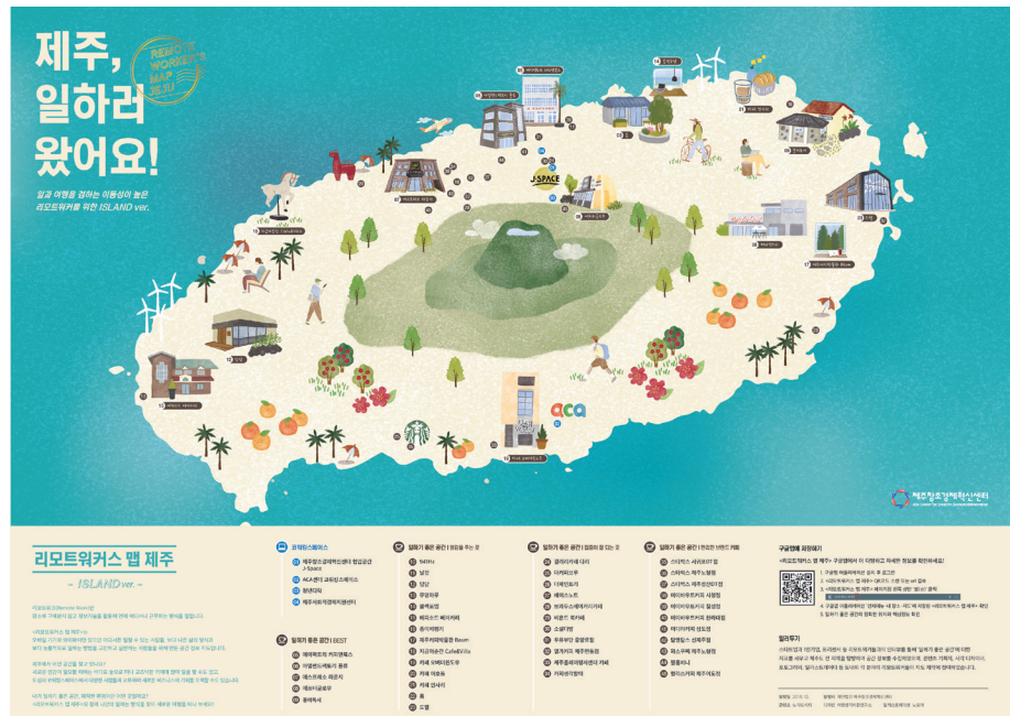
〈그림〉 리모트워커스 맵 제주